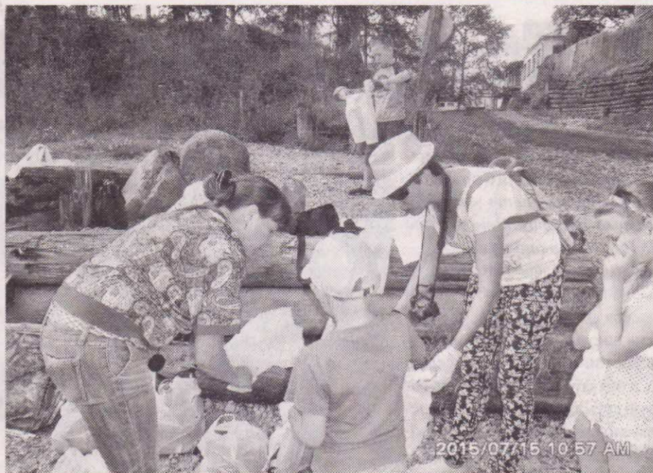
Уже три года подряд с нами на берег реки Витим, вооружившись мешками и перчатками, выходят дети из оздоровительного лагеря, в этом году было 46 ребят в возрасте от 7 до 13 лет

ческого содержания, потому все прохожие знают, что юные добровольцы – экологи идут убирать мусор за взрослыми, потому что мамские дети, как правило, не кидают битое стекло на берегу.