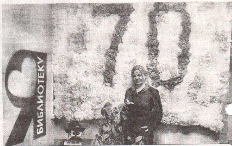
В холле была оформлена чудесная, воздушная инсталляция с цифрой «70», а также самый начитанный усатый читатель, оформленный из книг

Праздник начался с исторического экскурса, который провела ведущая ме-