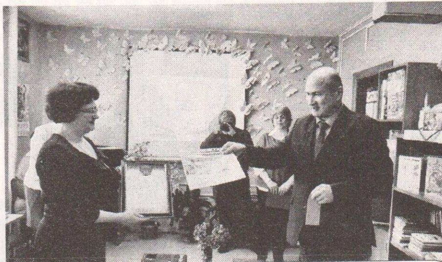
В свой юбилей библиотекари принимали многочисленные поздравления и подарки от руководителей района и посёлка Мама, представителей организаций п. Мама и своих верных читателей

Новое здание библиотеки приняло своих первых читателей в 1969 году. Тогда же при Центральной районной библиотеке было открыто детское отделение.