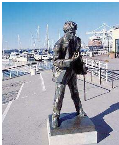
Окленд, памятник Джеку Лондону, уроженцу Окленда.

В биографии Джека Лондона наступил момент, когда он стал испытывать отвращение к писательскому труду. На этой почве он стал злоупотреблять алкоголем, что негативно сказалось на его здоровье. Страдая от заболевания почек, писатель в качестве обезболивающего использовал морфий. От его передозировки он и скончался 22 ноября 1916 года. Последним романом Джека Лондона стала книга «Сердца трех», опубликованная посмертно в 1920 году.