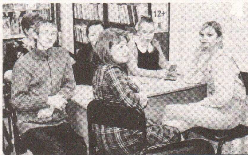
Команда «Тургеневская молодежь»