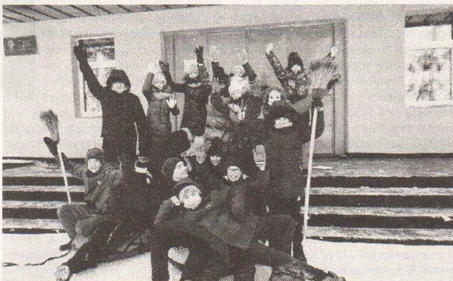
Участники спортивно-игровой программы "Юные защитники Отечества"