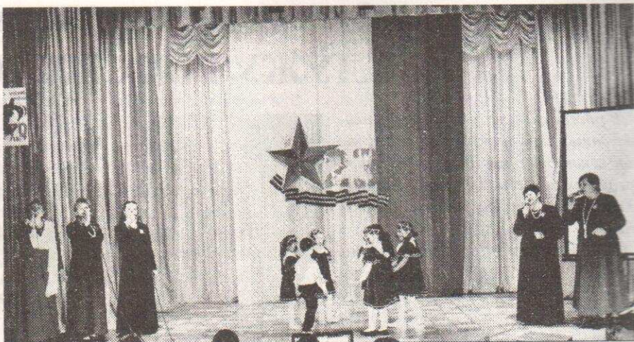
Вокальный коллектив детского сада "Теремок"

Участники – самодеятельные артисты активно готовились к конкурсной программе, много репетировали, подбирали сценические костюмы, даже правильный выход на сцену и объявления участников не остались без пристального внимания конкурсантов и бдительного взгляда художественного руководителя РКДЦ «Победа» Людмилы Третьяковой, кото-