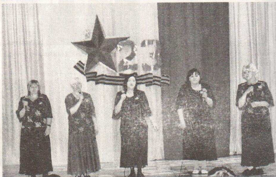
Вокальный коллектив "Северяночка", пос. Витимский

рая осуществляла помощь всем исполнителям в подготовке их прекрасных выступлений. И подготовка к фестивалю прошла не зря, каждая песня, каждый участник дали зрителю свою особую атмосферу праздника, гордости за свою страну и любви к родному краю.