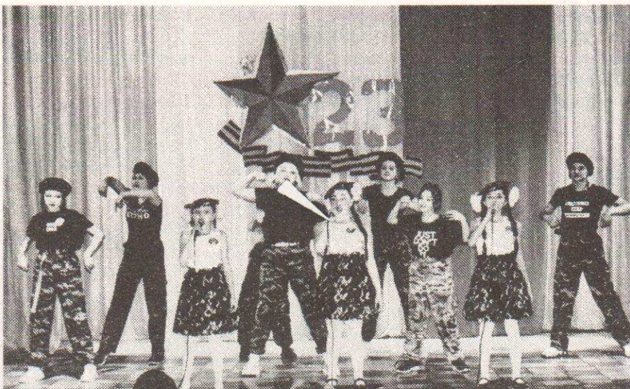
Трио "Феникс" и хореографический коллектив "Блэкстар" РДДТ

Коллектив РКДЦ «Победа» благодарит членов жюри за помощь, участие и