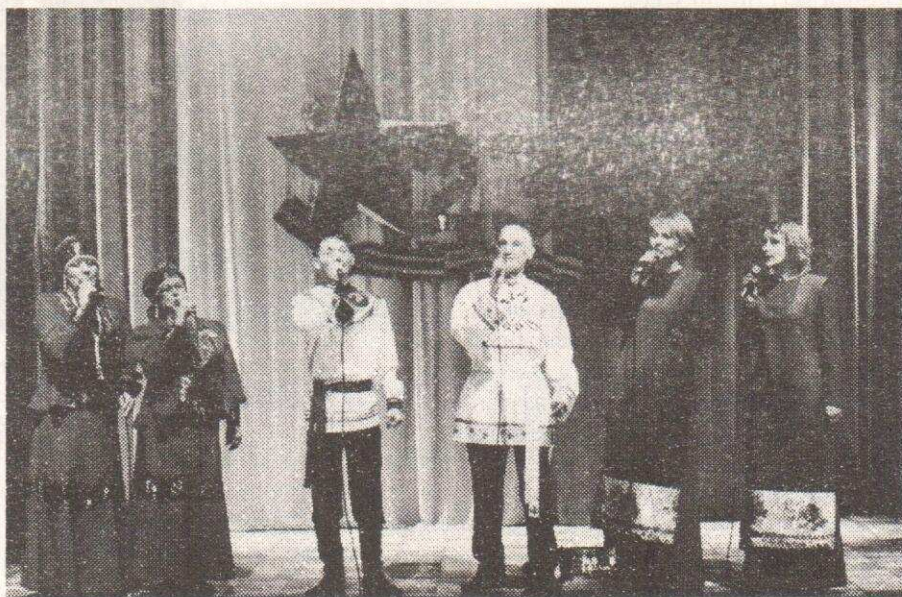
Народный фольклорный коллектив "Сударушки"

- Мне очень приятно, что в такое непростое время ограничительных мер, связанных с угрозой распространения коронавирусной инфекции, праздник 23 февраля стал ярким поводом собраться в зале РКДЦ «Победа» всем участникам и гостям фестиваля. Соревновательный дух и желание участвовать в подобных мероприятиях важный момент для сохранения и развития культуры района.