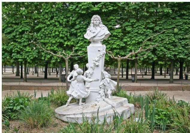
Памятник Шарлю Перро в парке Тюильри (Париж).

Суровым испытанием для Шарля Перро стало известие о трагической смерти сына Пьера в одном из сражений. Здоровье сказочника серьезно пошатнулось, и 16 мая 1703 года он ушел из жизни.