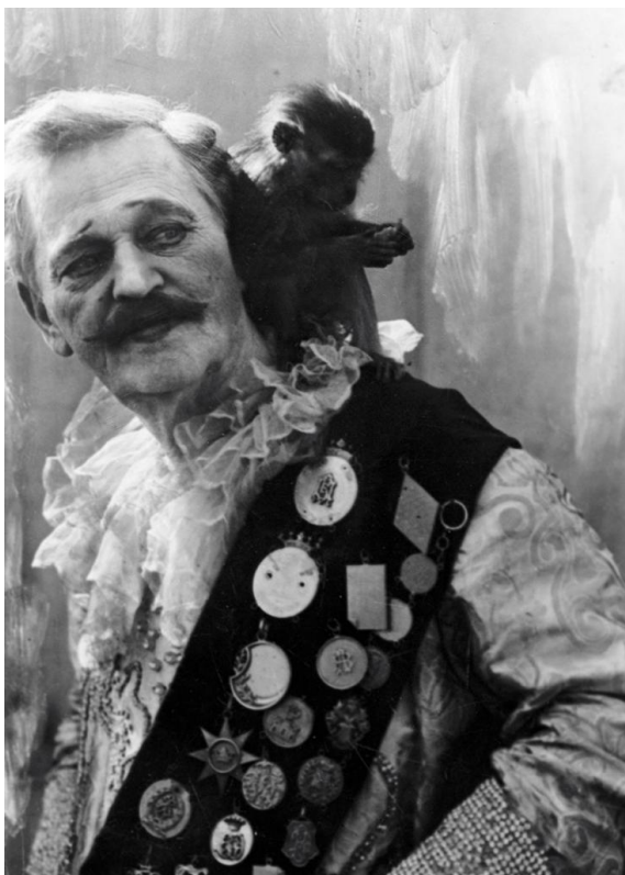
Знаменитый артист со своей ручной обезьянкой.

Н. Ю. Дурова родилась 13 апреля 1934 г. в семье потомственных цирковых артистов. Основатель цирка "Театр зверей имени Дурова", Владимир Леонидович Дуров, был прадедом будущей артистки. Он скончался через три года после рождения единственной на тот момент правнучки.