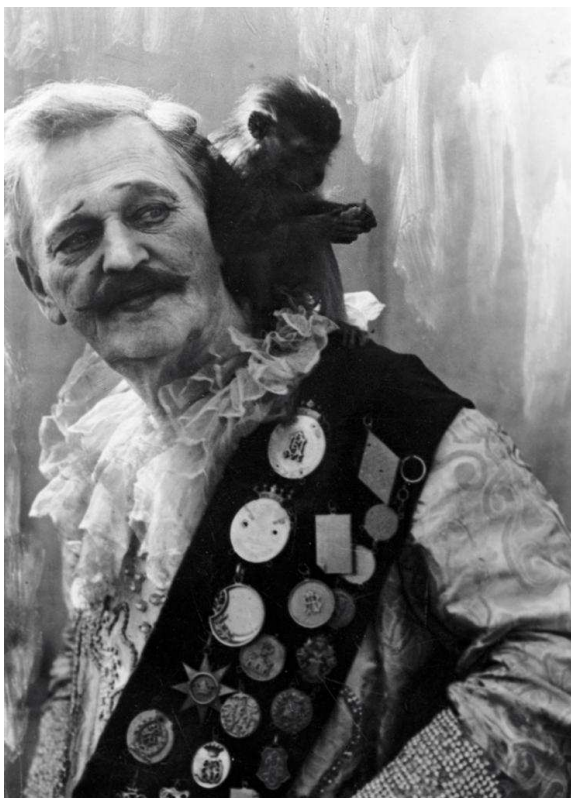
Знаменитый артист со своей ручной обезьянкой.

Н. Ю. Дурова родилась 13 апреля 1934 г. в семье потомственных цирковых артистов. Основатель цирка "Театр зверей имени Дурова", Владимир Леонидович Дуров, был прадедом будущей артистки. Он скончался через три года после рождения единственной на тот момент правнучки.