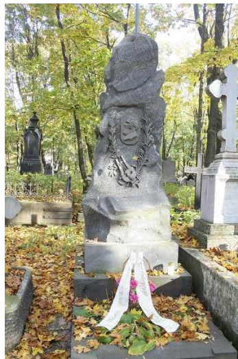
Могила А. Н. Майкова на Новодевичьем кладбище в Санкт- Петербурге.

Цикл стихов «Отзывы истории» Цикл стихов «Очерки Рима» Драма «Два мира» (1872) Драма «Три смерти» (1851) Драма «Смерть Люция» (1863) Полное собрание сочинений (1893)