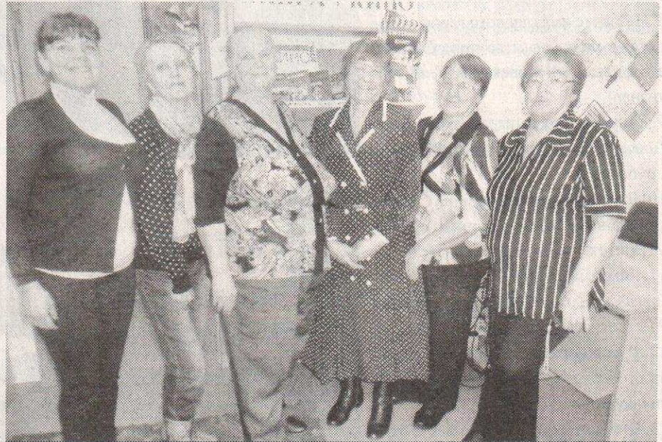
Кино-вечер «Читаем книгу - смотрим кино»